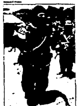
The EZLN single the country's flag

What made you choose these books? I don't really think about it too much. I saw that "you're going to leave, get your things ready." I packed some clothes and grabbed the books I had never read, because they were the ones I read or consulted most often. There were others, but I left them behind. So I threw the books into my bag and brought them with me into the jungle. I left them in the