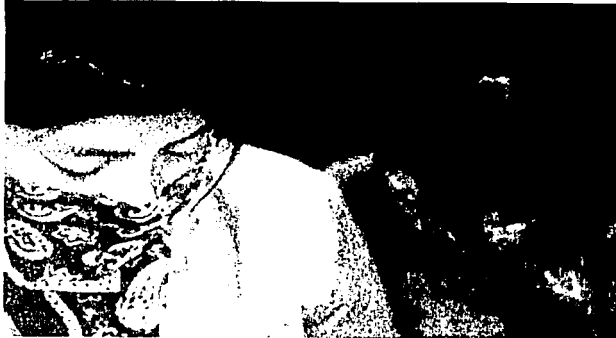
1.12 Mujeres zapatistas en reunión del Comité Clandestino.