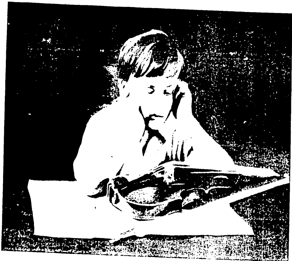
L.1. El chico y el violín