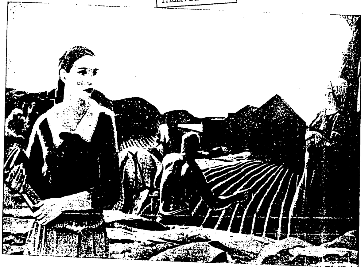
L. 2. La estudiante en el campo