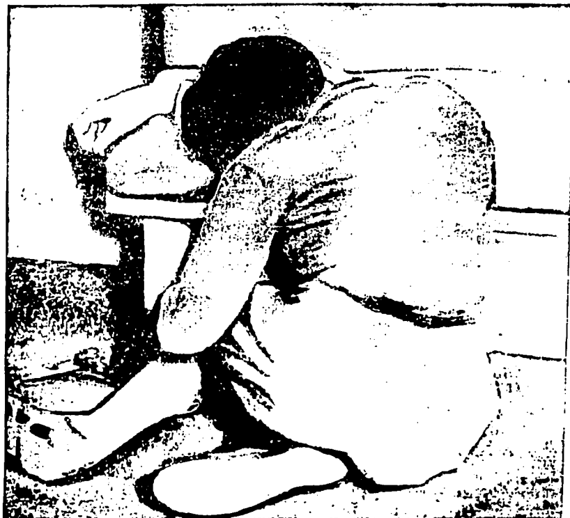
L. 3. V.H. Reclinado/a en el diván