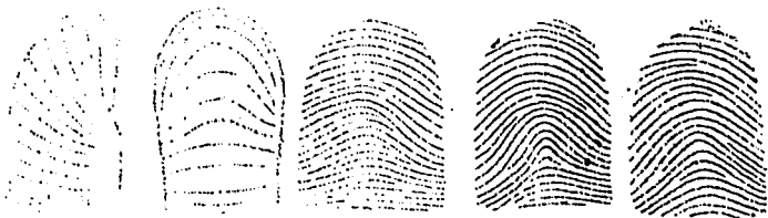
Fig. 12. — Tipos de Arcoas-Sistemas Vucetich.