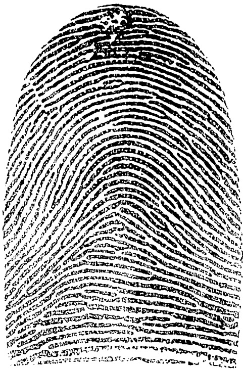
Fig. 11. — Sistema Vucetich.