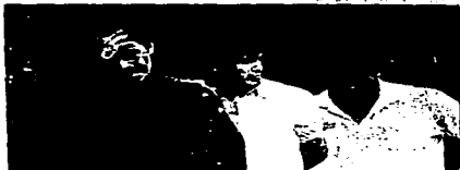
Familiares de uno de los policías aruera del Hospital Metropolitano.