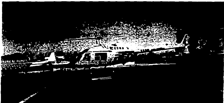
Uno de los helicópteros utilizados por Radio Difusión Red antes de ser adquirida por Grupo Radio Centro