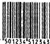
TABLA # 12