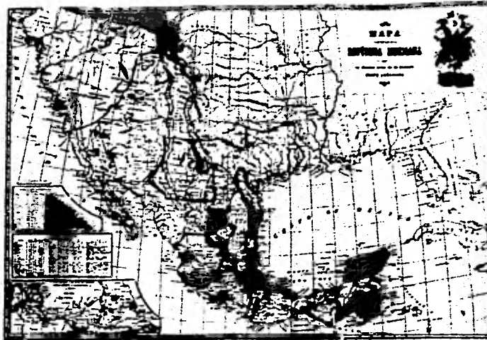
Se han perdido 110 000 leguas cuadradas de territorio

Como indemnización por esas pérdidas territoriales, México re-