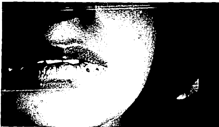
FIGURA 2. Paciente femenina de 22 años con lesiones únicas en labio inferior de intensa reactividad papular-prurítica de origen solar.