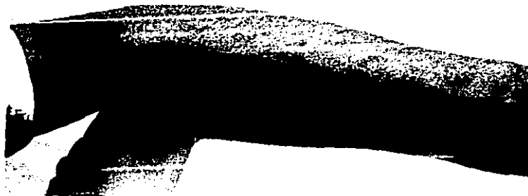
FIGURA 5. Mismo individuo con lesiones dermatológicas en brazos con presencia de lesiones papulares de sintomatología prurítica.