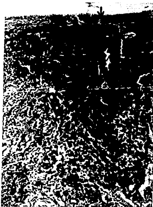
FIGURA 8. Queilitis Actínica de sintomatología pruriginosa mostrando en dermis denso infiltrado inflamatorio linfocitario con un folículo y proyecciones hacia la profundidad. Es notoria la atrofia epitelial.