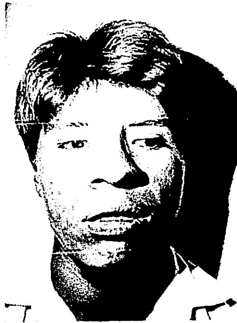
FIGURA 3. Síndrome reaccional cutáneo con pápulas, costras hemáticas y liquenificación en labio inferior y áreas adyacentes