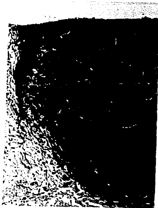
FIGURA 9. Imagen microscópica a mayor aumento en la que se observa un abundante infiltrado linfocitario circunscrito que rodea vasos, con capilares dilatados. La lesión simula a un linfoma.