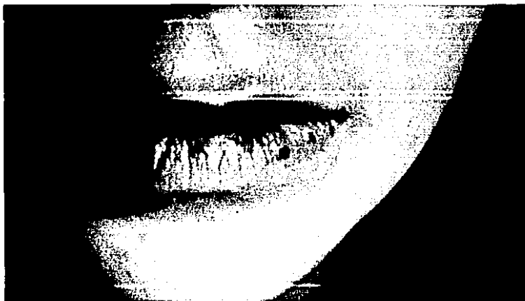
FIGURA 1. Lesión labial en la que se observa pápula en zona del bermellón con discreta macroquelia y síntoma prurítico.