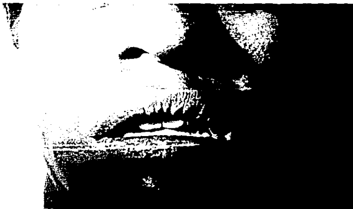
FIGURA 4. Macroquelia con áreas de hiperpigmentación en labio inferior y liquenificación (caso No. 2)