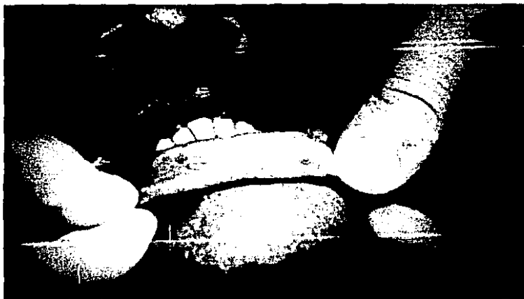
FIGURA 6. Lesión labial de aspecto papular con tendencia a ulcerarse por el rascado con discreta melanosis.