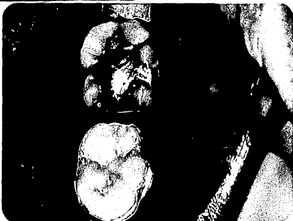
Vista colateral del retrato.