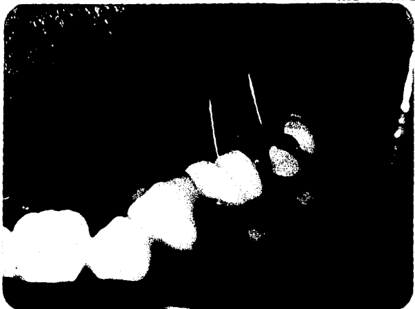
Vista lateral con el alfiler de latón y la goma del punto de contacto.