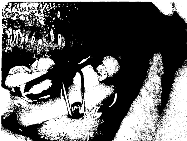
Vista lateral del retrato.