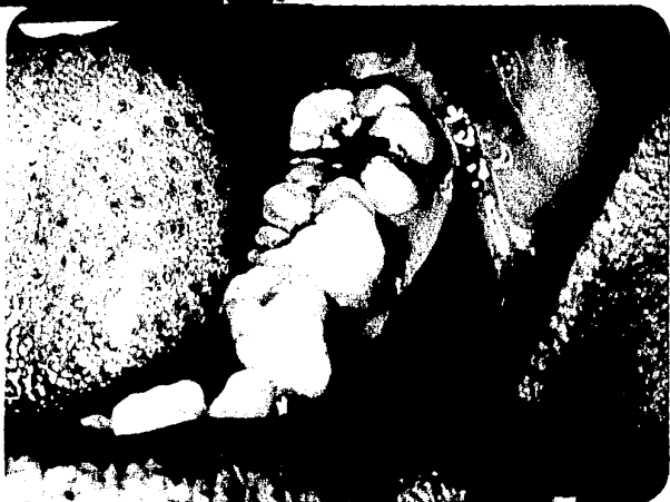
Vista lateral del molar ectópico.