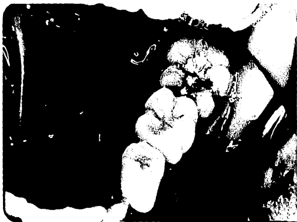
Vista lateral del molar ectópico.