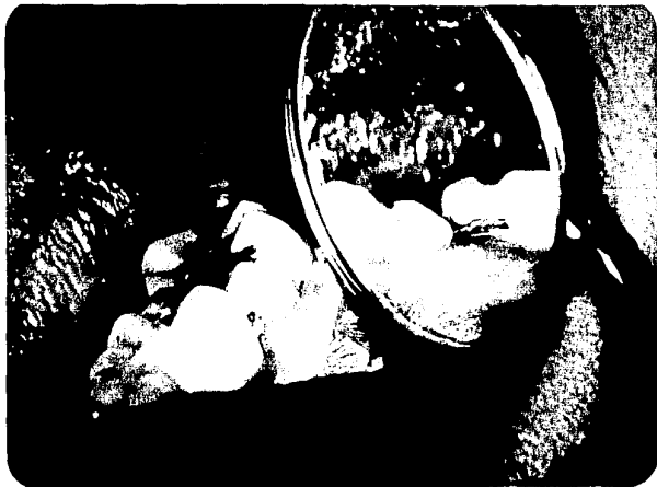
Vista lateral del retrato de latón en el museo.