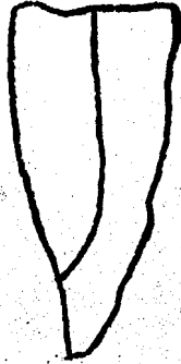
T. EN BISEL