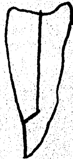
T. DE CHAPLAN BISELADO