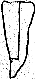
T. EN HOMBRO CON BISEL