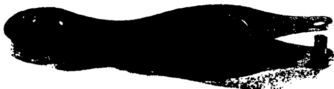
Figura 7. MUESCADOR. PERFORADOR DE MEMBRANA O EAR PUNCH DEVICE.