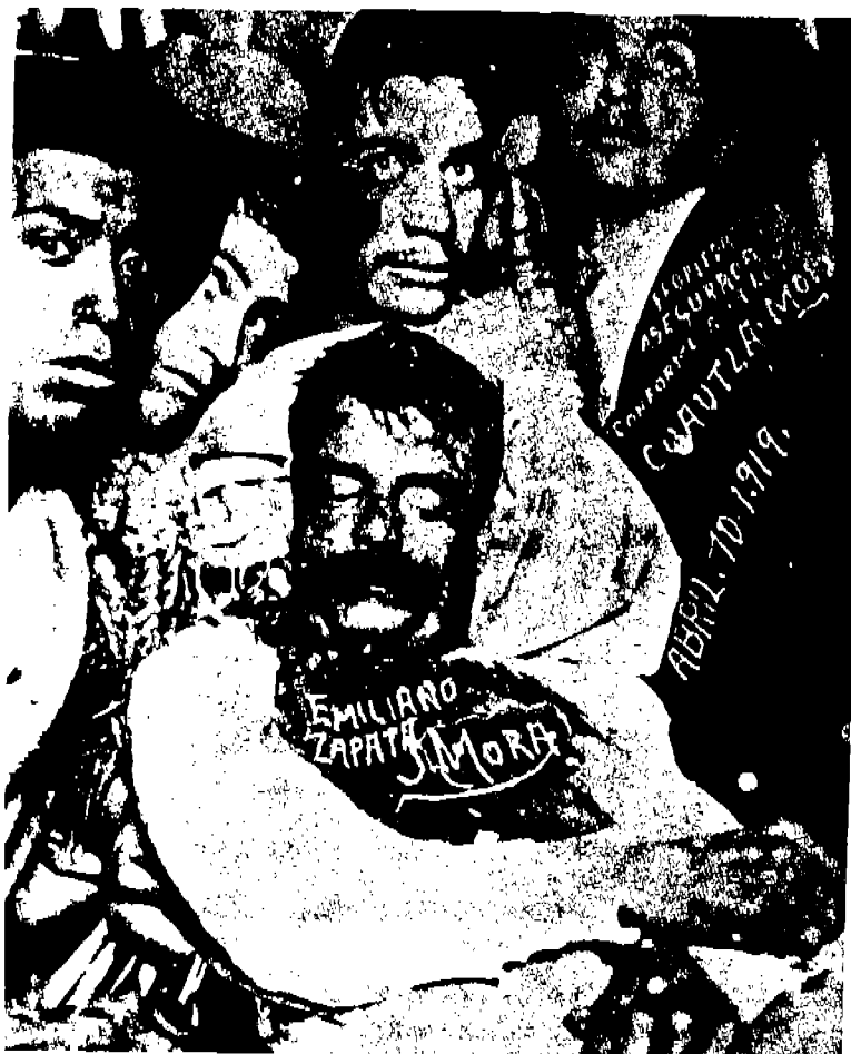
Emiliano Zapata, muerto.