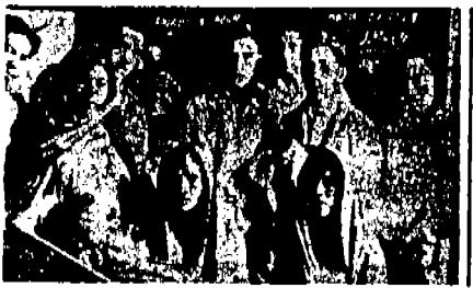
Los presos de Emiliano Zapata.

Algunos de esos periódicos publican además, la biografía del cabecilla, a quien llaman bandido, criminal nato, falto de cultura, capaz de las peores fechorías, que pasó estos últimos años de su vida en abierta rebeldía contra los gobiernos de México.