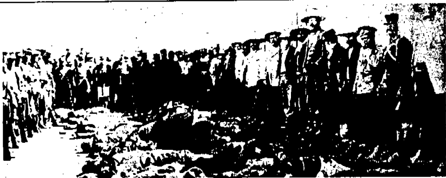
Revolucionarios insurrectos en batalla

Torreón está ya tranquila, pero en su ambiente flota un hálito de amargura, de miseria y de dolor.