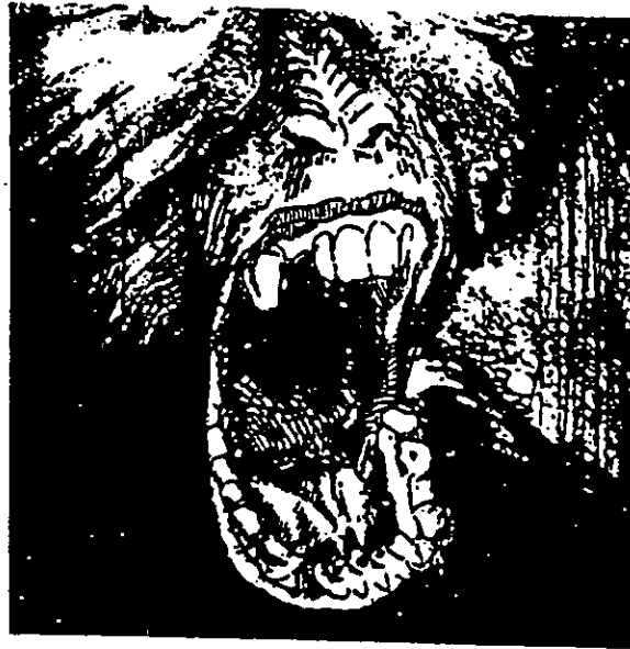
El primo en cristal (cat. 7)

nado estado de ataque directo e indirecto a un así como lo prefiera el ácido el magnífico al estado puro el que todo consigna en su afán de