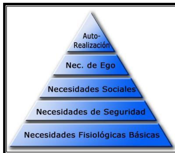
Tabla 2.1 Niveles de las necesidades humanas

Fuente: Motivation and Personality , 2ª. Ed, Por. A.H. Maslow 1970 Prentice Hall, Inc. Pág. 34