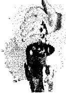
psicomotoras. 42 farmacos.37

Sedativo es el nombre que se da a los medicamentos capaces de disminuir la actividad del cerebro, principalmente cuando está en estado de excitación arriba de lo normal. El término sedativo es sinónimo de calmante, sedante o ansiolítico. Son utilizados por vía oral en forma de comprimidos o cápsulas y por vía intramuscular o intravenosa, se ha restringido su uso a nivel hospitalario, se encuentra indicado en personas muy nerviosas, tensas, estresadas o con insomnio actualmente se usa en personas que padecen epilepsia.