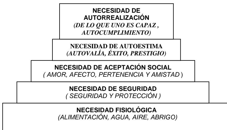
Fig. No. 2.- PIRÁMIDE DE NECESIDADES BÁSICA SEGÚN EL TEÓRICO MASLOW El ser humano alberga una serie de necesidades básicas que condicionan su vida y por lo tanto sus actividades diarias cambian o se modifican.

rendimiento y compromiso, no solamente en el ámbito escolar sino también en el plano individual y social, cabe mencionar que para que éste nivel se logre, se deben satisfacer las otras cuatro necesidades, por esta razón el ser humano que ha satisfecho esta necesidad está más liberado del motivo como primer elemento de satisfacción de necesidades.