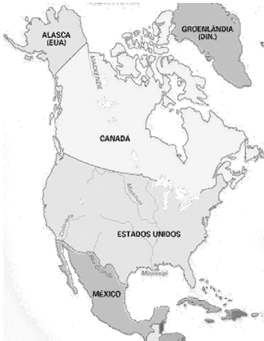
América del norte