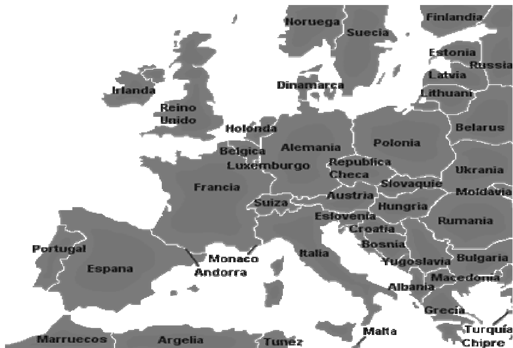
Mapa de Europa 73

Es uno de los continentes más avanzados y no por ello deja de ser una zona libre de terrorismo ya que ocupa el segundo lugar en número de organizaciones terroristas, no se notan con frecuencia los actos terroristas a menos que sean demasiado impactantes, ya que los medios de comunicación internacional controlados por occidente desvían la atención de los actos terroristas ocurridos en Europa para enfocarse en Medio Oriente.