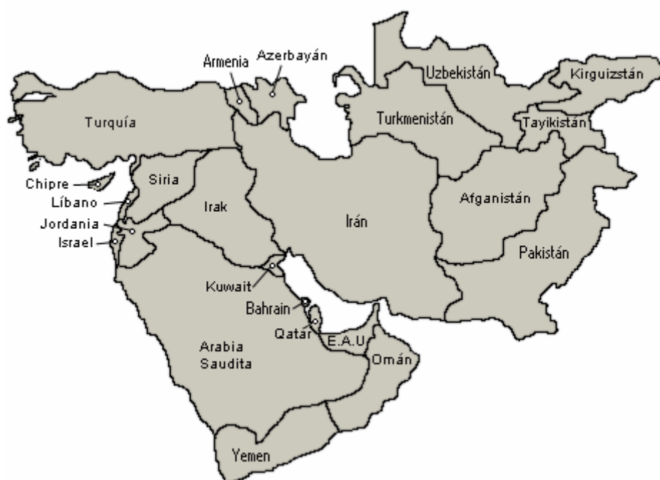
Mapa de Medio Oriente 71

Se encuentran alrededor de 42 organizaciones distribuidas principalmente en 7 países (Argelia, Egipto, Irán, Irak, Israel, Líbano