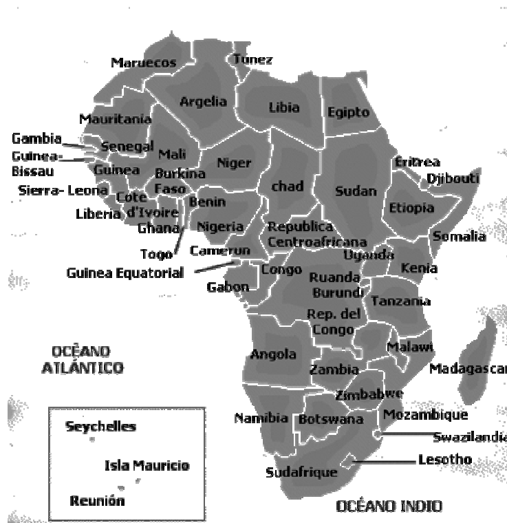
Mapa de África 81

es uno de los lugares con más terrorismo, se ve influenciada por ellos y ocurren ataques terroristas de nivel internacional como en 1998 contra las embajadas de Estados Unidos en Nairobi y Tanzania, de los cuales responsabilizaron a Osama Bin Laden. 80