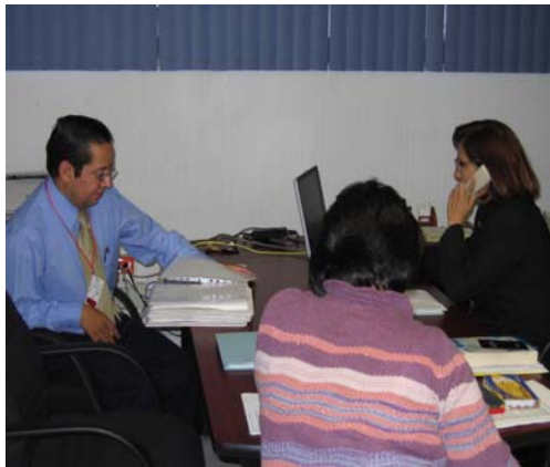
Imagen 4.3 Algunos de los participantes durante la emisión musical