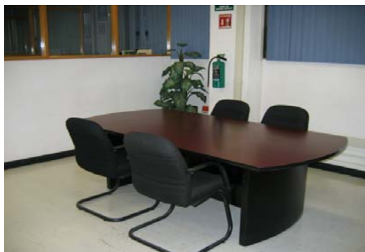
Imagen 4.2 Sala de juntas donde se colocó el aparato reproductor al emitir la música programada

Después de dar esta introducción se comenzó con la aplicación 1 del instrumento y se procedió a dar inicio al Programa de Musicoterapia. La música se eligió de acuerdo a lo planeado en la Propuesta.