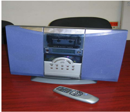
Imagen 4.1 Aparato reproductor de discos utilizado durante el programa de musicoterapia

Se les exhortó a emitir sus preguntas si es que las tenían o algún comentario que quisieran expresar antes de comenzar con los treinta días de musicoterapia.