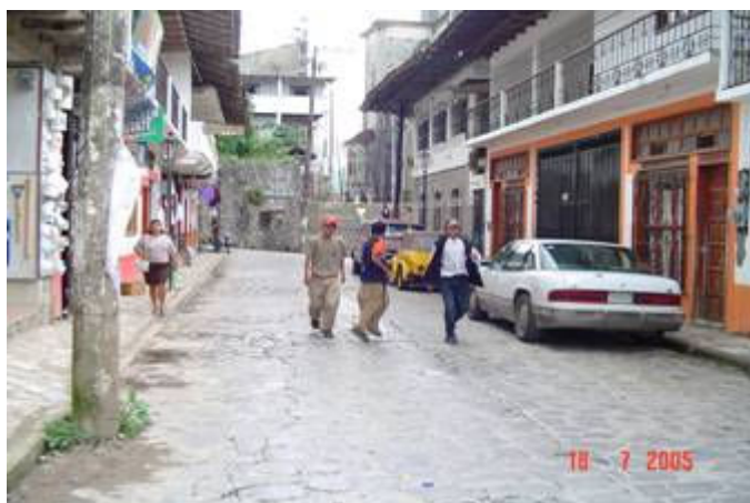
Jóvenes guías de turistas caminando en la calles de la cabecera municipal de Cuetzalan.