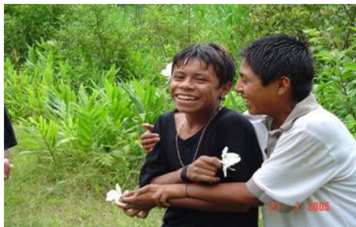
Guías de turistas haciéndose bromas, para corear el zon de Xochipitzahua.