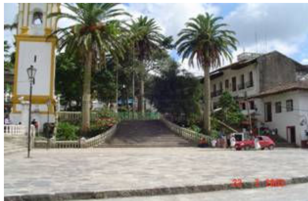
Plaza principal de la cabecera Municipal.