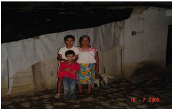
Niño guía de turistas con su mamá y hermano menor afuera de su casa en la comunidad de Tapitzaloyan.

Mamá de guía de turistas con la indumentaria característica de la región, se aprecia la disposición del espacio al interior del hogar, así como el almacenamiento de la madera empleada como combustible, la Sra. Pertenece a la organización de médicos tradicionales Maseualpajti .