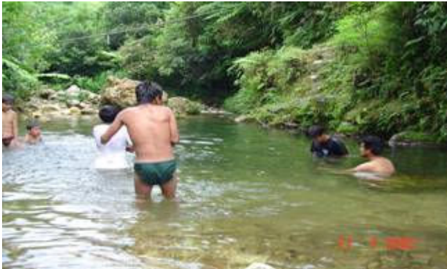
Guías de turistas nadando en el río de Cuichat.