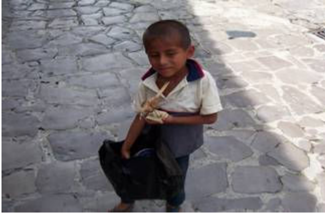
Niño vendiendo artesanías en la cabecera municipal, originario de la comunidad de San Miguel Tzinacapan.