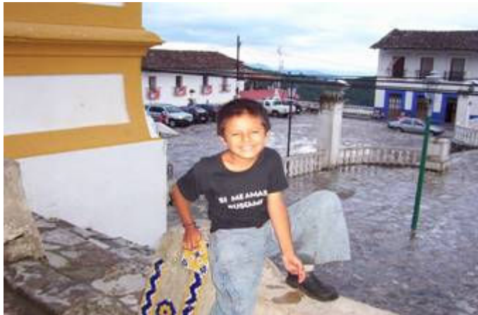
Niño guía de turistas, residente de la cabecera municipal, en el atrio de la iglesia, en espera de turistas.