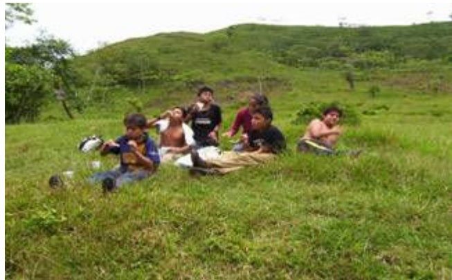
Disfrutando del refrigerio, después de nadar.