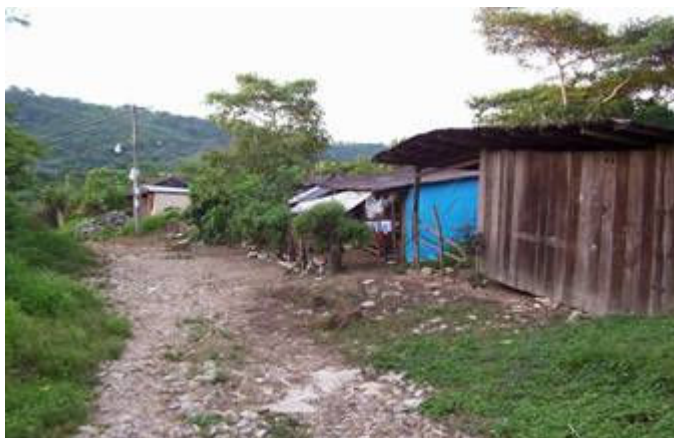
Comunidad de Cuapech y hogar de guía de turistas, en donde se puede apreciar la riqueza natural, así como el material de construcción de las viviendas.