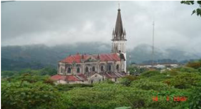
Vista panorámica de la Iglesia de “los jarritos”.