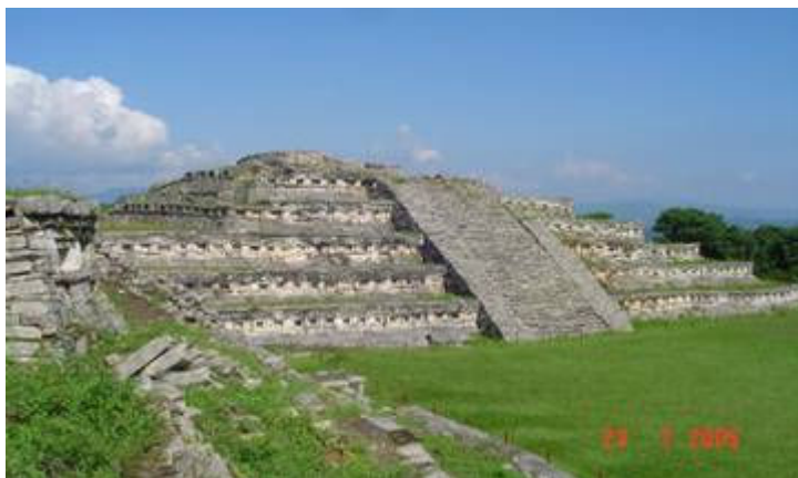
Zona arqueológica de Yohualichan (La casa de la noche)