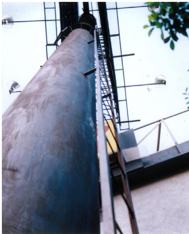
FOTOGRAFÍA 13: Escalera, cuerdas y una dosis de adrenalina

Mientras tomaba esta fotografía, Trash me habló sobre las dificultades para realizar un graffiti. A veces hay una escalera para subir a un espectacular, otras ocasiones se ha de confiar en el propio cuerpo o en la ayuda del crew.