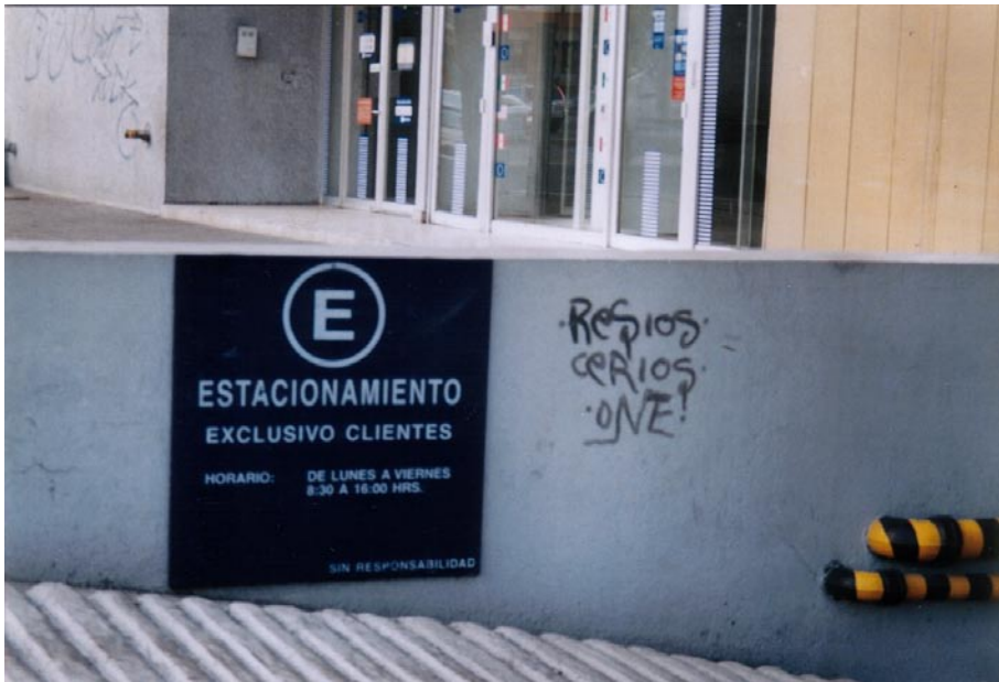
FOTOGRAFÍA 2: Resios, Cerios, One!

Al igual que en la fotografía 1, en ésta vuelve a aparecer el término “Exclusivo”. Asimismo, en esta imagen resaltan dos elementos importantes, el primero es el recuadro azul marino que indica que ese sitio es “Estacionamiento Exclusivo Clientes”, además de señalar el horario. El segundo es el graffiti que contradice al texto anterior. O tal vez habrá que considerar que los graffiteros también son parte de la clientela del banco localizado en el 111 del bulevar Manuel Avila Camacho.