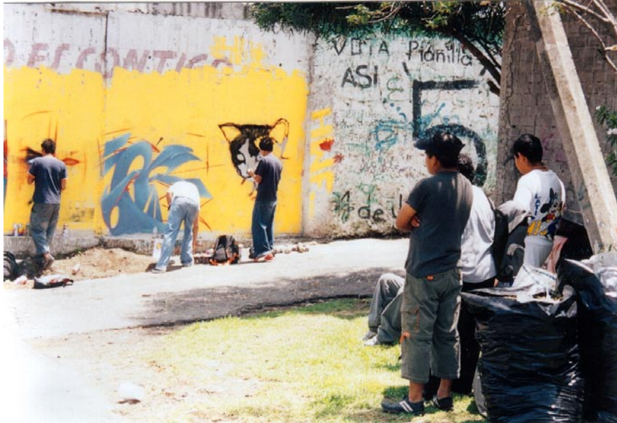
FOTOGRAFÍA 14: El crew FC, espectador expectante

Los integrantes del crew FC , al ir a una exposición de graffiti straight , como aprendices, observaron técnicas, compraron aerosoles y se quitaron, un poco, el control familiar al desplazarse de Chalco a la delegación Magdalena Contreras. En el camino pintaron algunos tags en los asientos de un microbús.