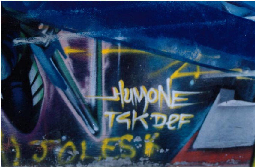
FOTOGRAFÍA 30: Variante del tag de Humo

El tag muestra una de las características de la firma graffitera: la variación lúdica. Esto es, al seudónimo personal se le puede agregar una o más letras. Por ejemplo, Humo , Humone . Este último tag también juega con la palabra one que sirve a los graffiteros para indicar que están rayando solos, es decir, sin crew . También se puede sustituir una o más letras del tag. Por ejemplo, el tag de Ocre puede ser pintado Okre .