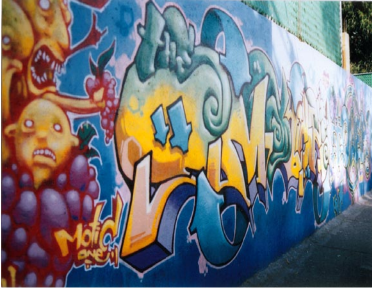
FOTOGRAFÍA 4: El mural de Echegaray

Analizado en el apartado 3.4 de esta investigación, el mural estuvo, de sur a norte entre el número 4 del bulevar Manuel Ávila Camacho y el puente vehicular que va hacia Santa Cruz Acatlán (donde se encuentra la Facultad de Estudios Superiores Acatlán) y San Mateo.