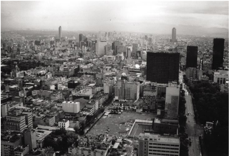
FOTOGRAFÍA 3: ¿Ciudad de México, ciudad comunicada?