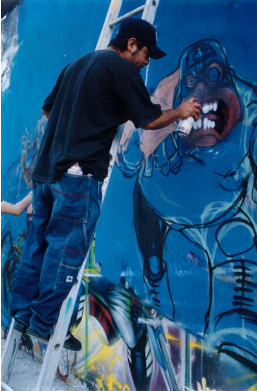
FOTOGRAFÍA 6: Humo en movimiento

Humo comienza a detallar uno de los caractereres que conforman el mural straight pintado en la calle Marcelino Absalón de la Colonia Ampliación Santa Martha de la Delegación Iztapalapa en la Ciudad de México.