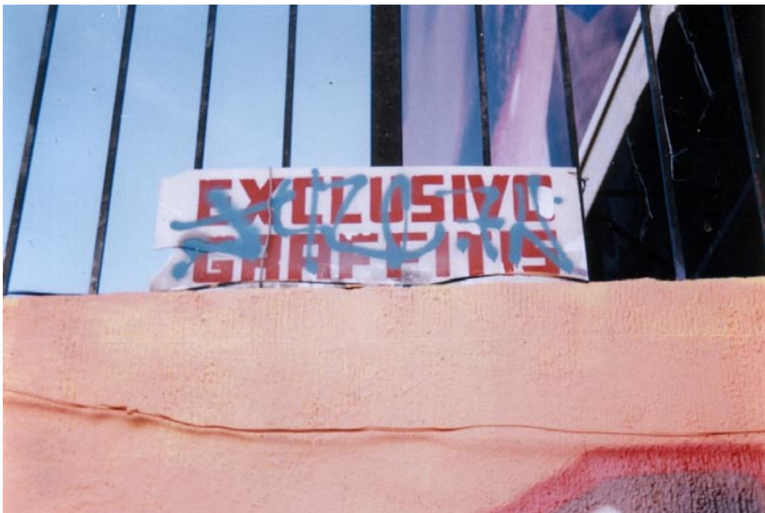
FOTOGRAFÍA 1: Exclusivo Graffitis

Placa colocada en la parte superior de la barda del estacionamiento de un negocio ubicado en el bulevar Manuel Ávila Camacho 675.