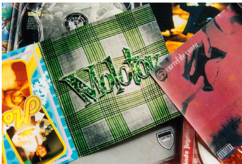
FOTOGRAFÍA 17: Hip Hop contra sí mismo