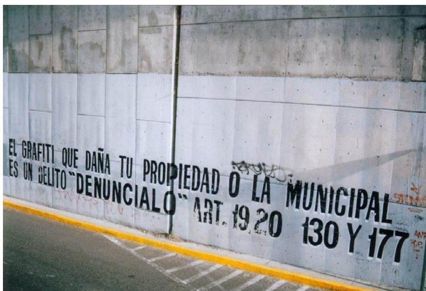
FOTOGRAFÍA 29: El graffiti de las autoridades

Las autoridades utilizan el muro de un puente vehicular para informar que el graffiti es un delito. ¿Y si la sociedad opta porque los espacios públicos sean suyos y no de las autoridades? ¿Por qué en la misma ciudad, las leyes del Distrito Federal y las del Estado de México se contraponen o, al menos, son contradictorias y poco claras? ¿Se puede hablar de un graffiti institucional, sabiendo que el origen de dicho fenómeno es la ilegalidad, cuando lo institucional insiste en señalar su legitimidad?