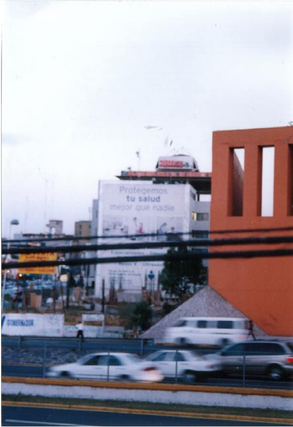
FOTOGRAFÍA 12: Plaza Satélite, límite de la caminata

Las preguntas armadas paso a paso en el trayecto hecho con Trash sirvieron como punto de partida, como base de los cuestionarios de algunas entrevistas, entre ellas la del editor de las revistas Rayarte y Black Book , así como la del crew FC . Después se apreció que las preguntas adecuadas al momento y las circunstancias particulares de cada entrevista, permitían fluir más y mejor la charla y que ello redituaba en la obtención de datos que eran relevantes para el entrevistado, toda vez que los refería, o incluso, cuando al hacersele un cuestionamiento específico, éste optaba por responder apenas tangencialmente.