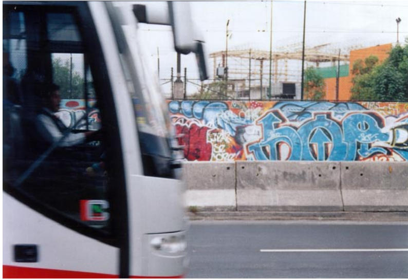
FOTOGRAFÍA 22: Peligro y color