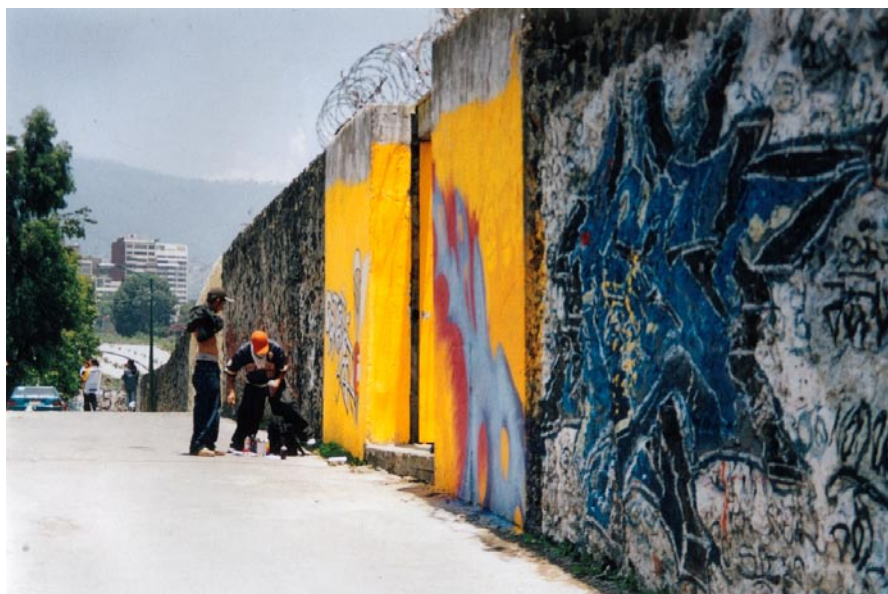
FOTOGRAFÍA 7: El puente de la ignominia

A partir del primer día de agosto del 2004 entró en vigor la Ley de Cultura Cívica para el Distrito Federal (LCCDF). Una semana después, carteles contra el anunciado desafuero del entonces Jefe de Gobierno Andrés Manuel López Obrador fueron colocados en mobiliario público sin contar con autorización. El acto fue una infracción al Artículo 26 de dicho documento (Ver Anexo 4). "Por la tarde, personas que se transportaban en una camioneta con el logotipo de la 59 Legislatura de la Cámara de diputados y el nombre de la legisladora Susana Manzanares, realizaban pintas en los bajopuentes en contra del desafuero." (González, A. 2004:1B)