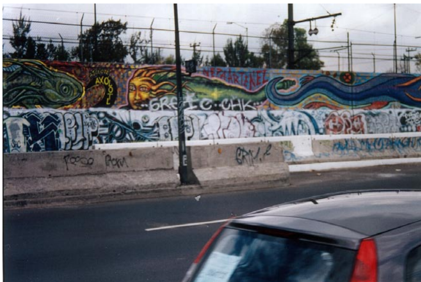
FOTOGRAFÍA 16: Los ajolotes de la discordia

Cuando Fly se refirió al CNAN , mismo que realizó el graffiti que aparece en la fotografía, dijo que ese grupo es de muralistas y que al asumirse como graffiteros se ponen una camiseta que no les corresponde.