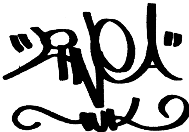
FOTOGRAFÍA 27: Tag de Fly, asesino de paredes

“Cómo dice el de los vinos... pues porque me gusta, ¿no? Aparte yo creo que... a mí me arrancó una pasión, ¿no? Todos los chavos se iban a bailar a los antros, se iban a hacer otras cosas... yo creo que el utilizar un aerosol para hacer cualquier cosa a mí me robó todo completamente: imaginación, tiempo. Y ahora... pues vivo de esto.”