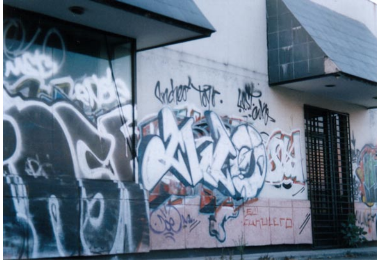
FOTOGRAFÍA 24: Pared terroreada por toys

En el 1829 del bulevar Manuel Ávila Camacho encontré una gran cantidad de elementos constitutivos del fenómeno graffiti.