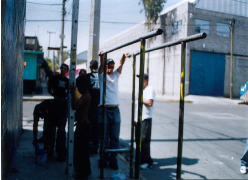
FOTOGRAFÍA 8: La calle y los graffiteros

¿Es su “gimnasio”, su “hogar”, su “parque de diversiones”, su “escuela”, su “oficina”? ¿Instituciones como la familia, la escuela y las dependencias especiales del Estado que tienen entre sus fines: el afecto, la educación, la salud, el trabajo y la recreación, han cumplido de manera cabal y satisfactoria, así como con calidad, con la función para la que fueron creadas? ¿O han sido rebasadas por la nueva realidad de los jóvenes y su existencia (la de las instituciones) es cuestionable? ¿Es la sociedad quien ha llevado a los jóvenes graffiteros a la transgresión? ¿O quién o qué? ¿En qué circunstancias?