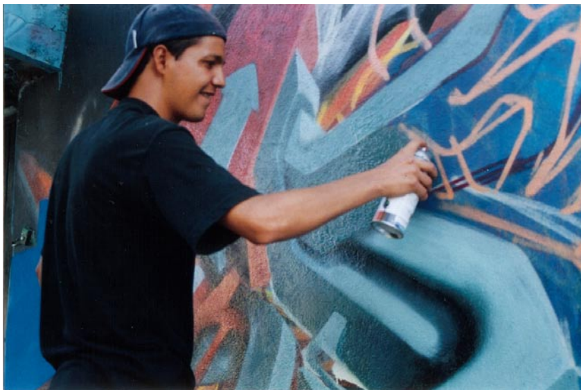
FOTOGRAFÍA 20: Ocre y sus trazos sin fronteras

Tranquilo, Okre se apodera de una lata y al lado de Mona y Humo pinta un graffiti straight .