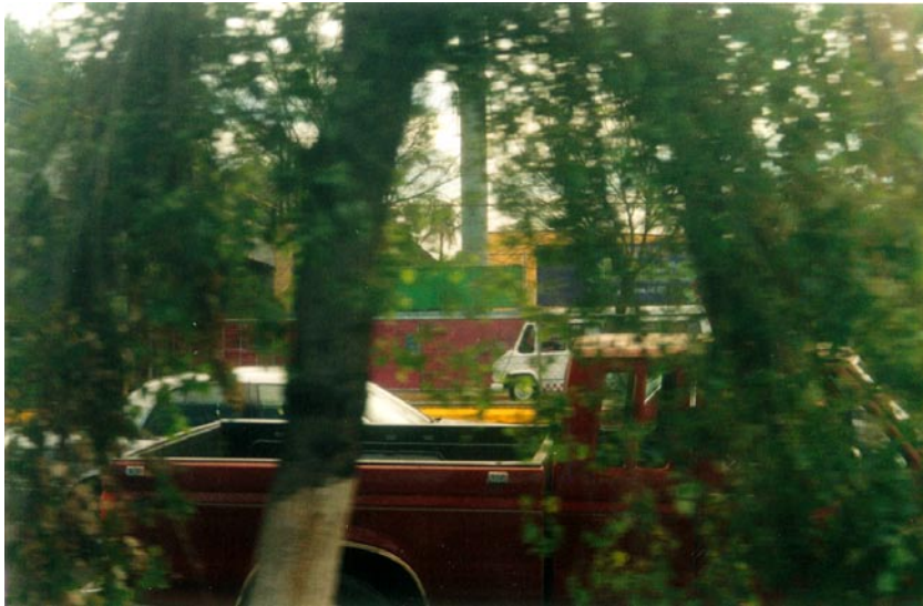
FOTOGRAFÍA 26: El final en rosa del mural de Echegaray