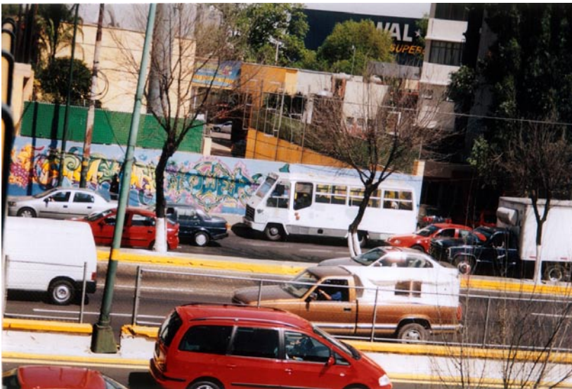
FOTOGRAFÍA 23: Vista panorámica del mural de Echegaray

¿El graffiti, con su esencia ilegal, vandálica para unos, poética para otros, ha logrado enganchar a la sociedad en su particular proceso de comunicación? ¿Los graffitis son indiferentes para todos los receptores? ¿Qué hace que una persona se interese en decodificar los signos enmarañados entre gotas de pintura de distintos colores, calidades, formas, autores, mensajes e intenciones? ¿En una sociedad cuya vía de comunicación es el monólogo, importa la forma tener voz o de “recuperar el habla”?