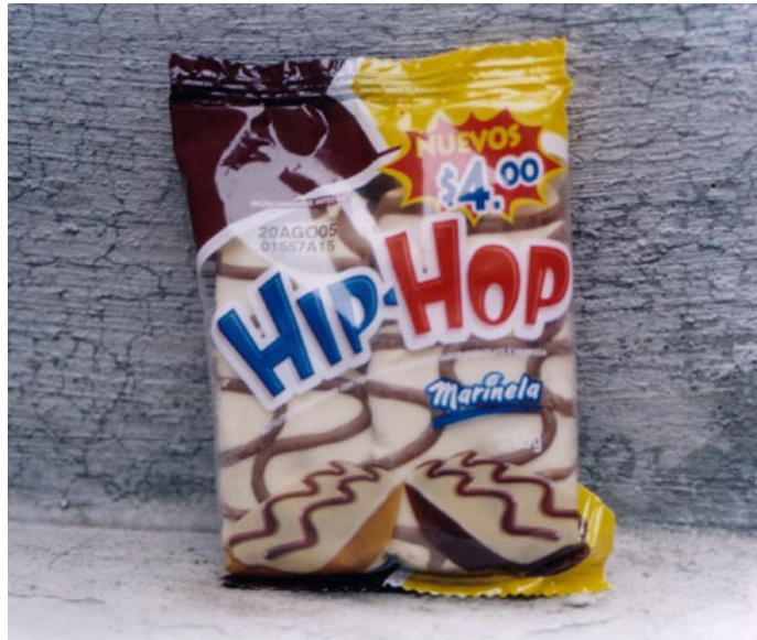
FOTOGRAFÍA 5: El hip hop da para comer y más

Posteriormente, con la emigración de jamaicanos e ingleses, de uno a otro país, se produjo la segunda etapa del ska , conocida como Two Tone . Las peculiaridades de la variante fueron el aumento de velocidad en el ritmo y la reducción de metales en su sonido, entre otras. Algunos grupos importantes del momento fueron Bad Manners , Madness , Selector , The Beat , The Specials y The Toasters .