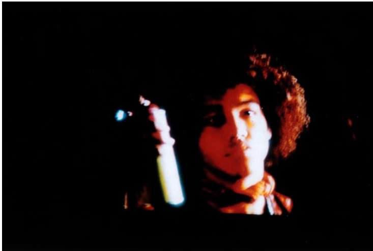
FOTOGRAFÍA 25: Fotograma de The Warriors

Disuelta la UGA algunos de sus miembros continúan sus estudios en el Pratt Institute of Arts y en la School of Visual Arts .