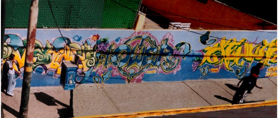
FOTOGRAFÍA 10: El mural straight

Primero, hay que considerar al graffiti como texto. Después conviene decir que hice un análisis textual del graffiti, el cual fue posible al complementarlo con otras dos actividades: describir e interpretar. Para comenzar doy una definición preliminar del graffiti.