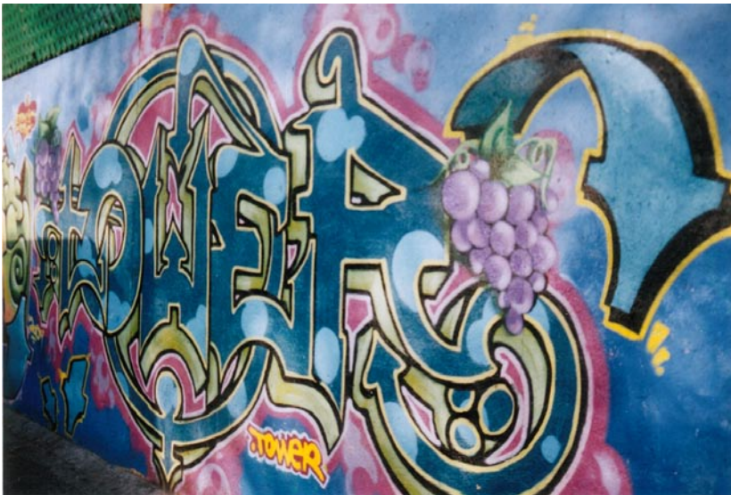
FOTOGRAFÍA 11: Flechas y uvas, huellas digitales de Tower