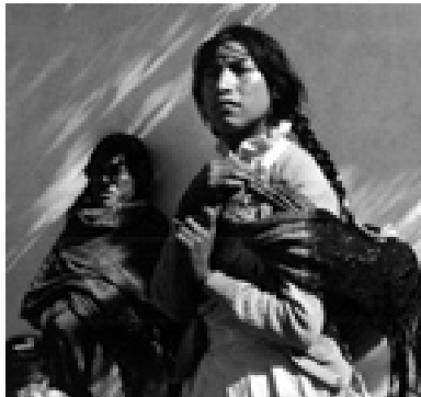
Vestuario tradicional Mazahua

La indumentaria del hombre consiste en el calzón, camisa de manta, huaraches y sombrero de paja de trigo, que por lo general utilizan personas de más de 50 años. El vestuario común del hombre es la camisa y pantalón del mismo tipo que la del mestizo; el vestido tradicional de la mujer también tiende a desaparecer” 3 .