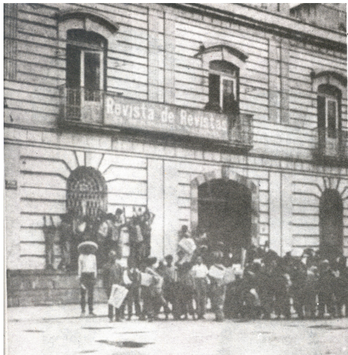
Antiguo edificio de Revista de revistas en la calle de Colón

Antiguo Edificio de Revista de revistas, en la calle de Colón