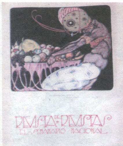
Portada de 1919