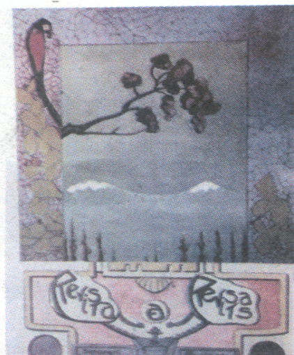
Portada de 1918

A continuación se muestran algunas portadas de la revista: