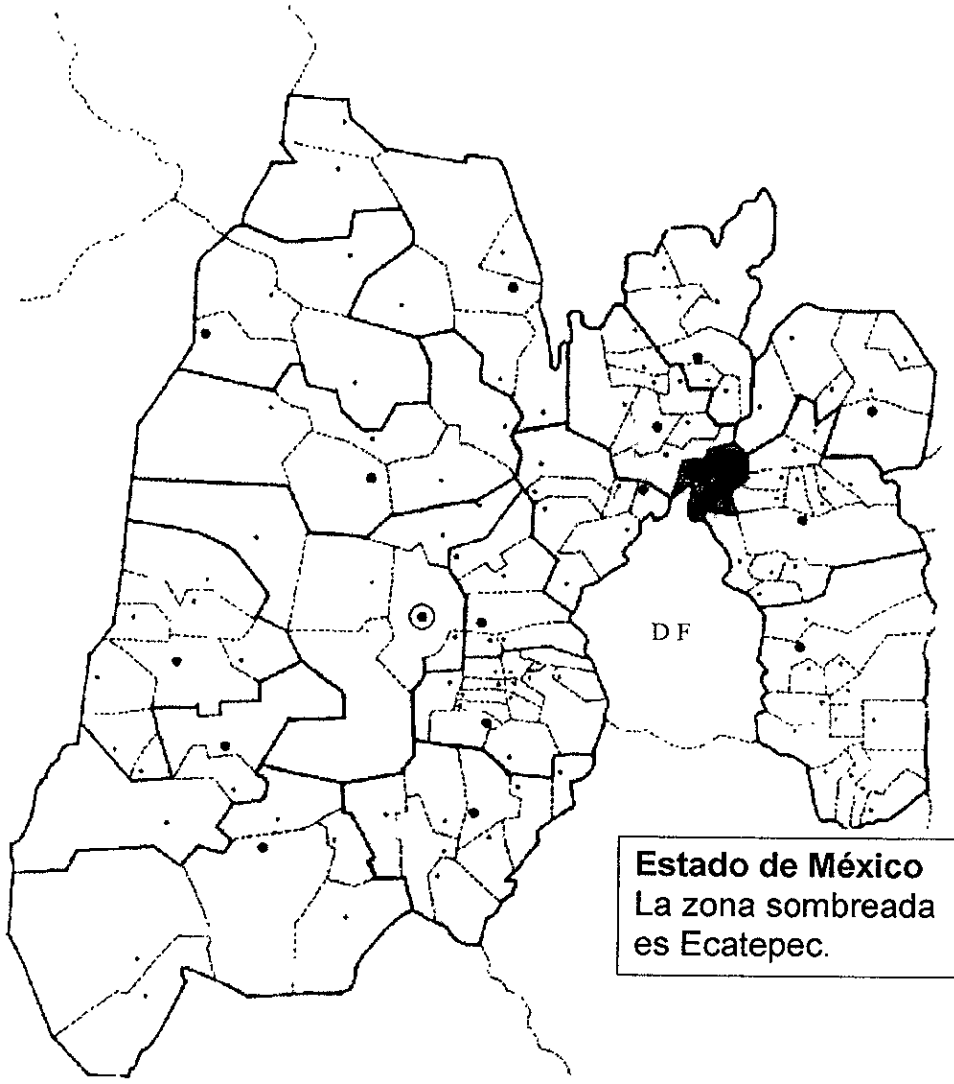
Estado de México La zona sombreada es Ecatepec.