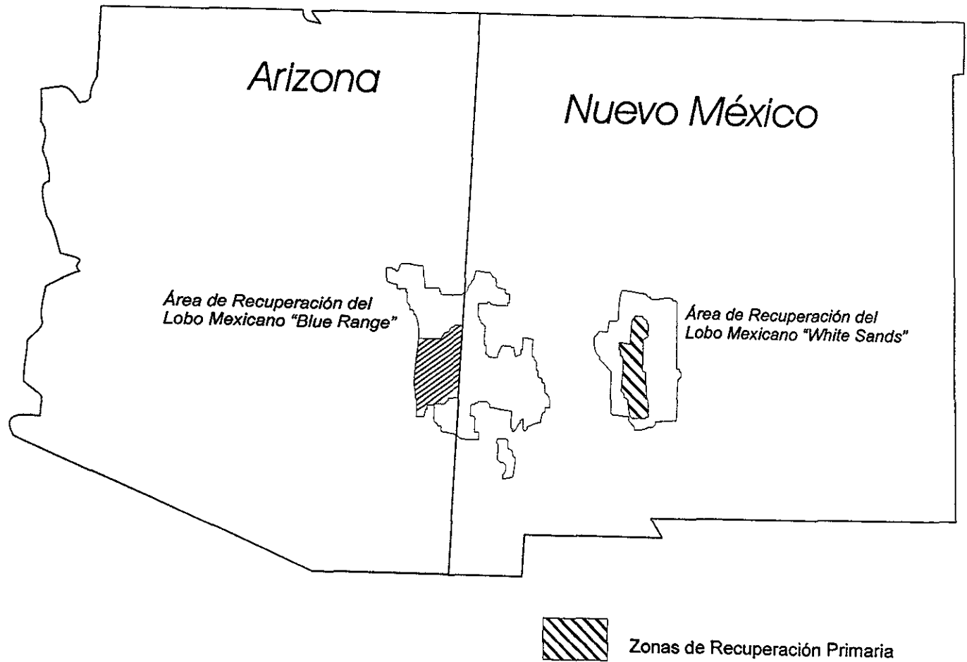
Figura 3: Zonas propuestas para la liberación de Lobos Grises Mexicanos ( Canis lupus baileyi )